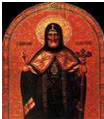
Икона свт. Митрофания

Когда стоишь перед входом в храм, то перед тобой возвышается высокое краснокаменное здание, с четырьмя большими куполами и одним маленьким. Когда на них попадает солнечный свет, то они ослепляют своим золотым цветом. Благодаря этой красоте церковь заметна издалека.