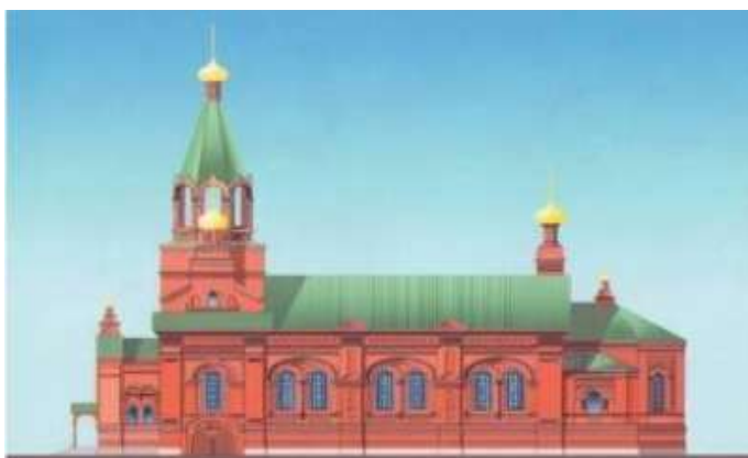
Проект реставрации Митрофановского храма

В настоящее время церковь обновляется и в прямом и в переносном смысле. Храм реставрируется. Многие дети и взрослые причащаются в праздники, люди стали осознанно ходить в храм и принимать христианскую веру. Наверно, это правильно, потому что здесь забываешь о заботах и делах и полностью отдаёшься себе, своей душе, собственным мыслям, чувствуешь необычайное спокойствие, бодрость, появляется чувство защищённости и умиротворения в наше нестабильное время.