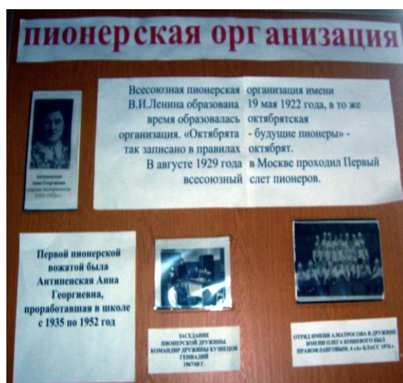
Одна из новых экспозиций, оформленных краеведами