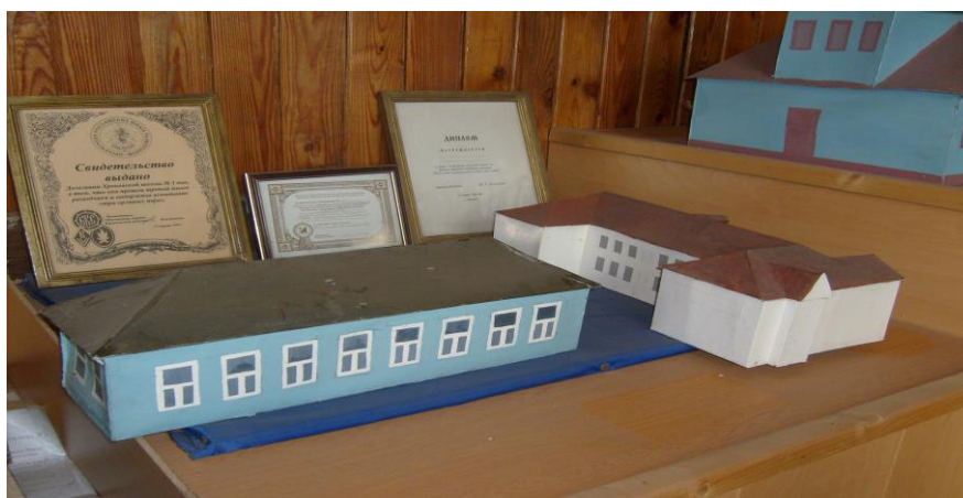
Отреставрированные макеты школы