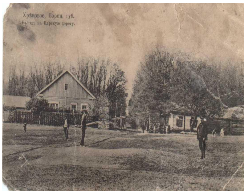
Дореволюционная открытка с видом с. Хреновое - выезд на Царскую дорогу